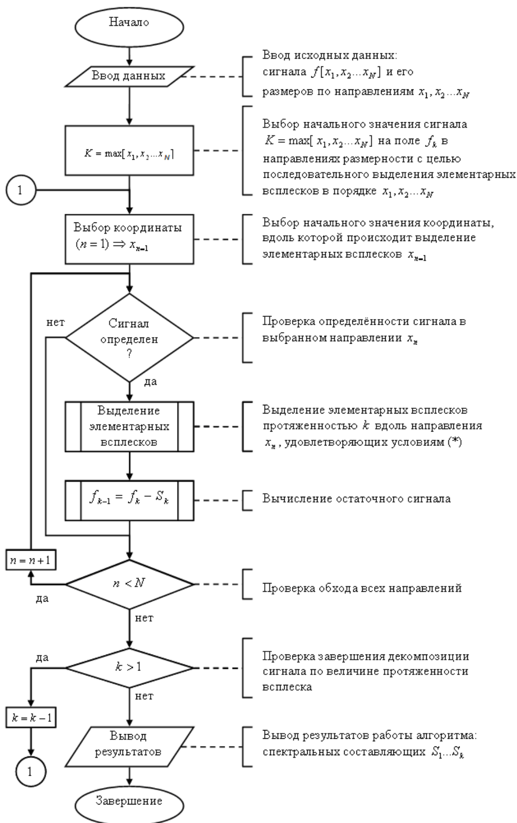
Рис. 1. Блок-схема алгоритма декомпозиции N -мерного сигнала по базису ортогональных всплесков.

(*) Условия выделения элементарных всплесков: